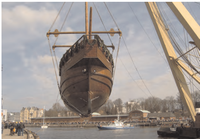
Stapelhub der LISA von LÜBECK

Vor dem Stapelhub bekam das Unterwasserschiff nach seiner Kalfaterung eine Wurmhaut aus 0,8 mm starkem Kupferblech. Es schützt das Eichenholz vor der Bohrmuschel „Teredo Navalis“, auch Schiffsbohrwurm genannt.