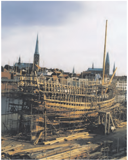
Blick auf den Bauplatz (2002)

Auf den GL-Richtlinien basiert auch die Mindestplankenstärke von 65 Millimetern. Das Holz für die Eichenplanken wurde im Sägewerk aufgetrennt und zwei Jahre abgelagert. Im Frühjahr 2002 konnte der Rumpf beplankt werden. Zuerst wurde jeder vierte Plankengang angenagelt. Anschließend folgte jeweils ein Plankengang über und unter dem vierten Gang. So blieb zwischen drei Planken jeweils ein