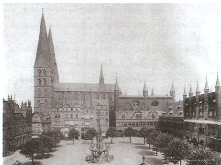
Der Markt um 1930

In dieser Zeit wurden rings um den Markt herum Linden gepflanzt. Damit reduzierte sich der Markt mehr oder weniger auf einen Zierplatz ohne seine frühere wirtschaftliche Bedeutung.