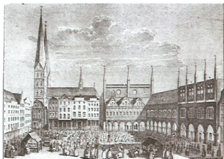
Der Markt um 1850

1873 wird die große Veränderung des Marktes eingeleitet. In der Mitte des Platzes wird ein Springbrunnen errichtet, zu Ehren der Gründer und Beschützer Lübecks (Figuren von Graf Adolf der II, von Schauenburg, Heinrich der Löwe, Kaiser Barbarossa, Kaiser Friedrich der II).