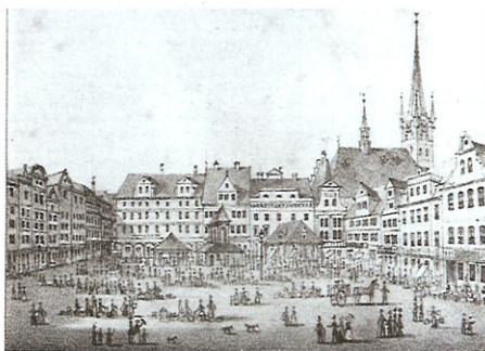
Markt von 1630

Die Gewandschneider hatten ihren Platz im ältesten Teil des Rathauses, wo sich auch die Tuchhalle befand. Ein besonderer Bereich stand den Goldschmieden zur Verfügung. Ihre Buden waren unter den Rathausarkaden.